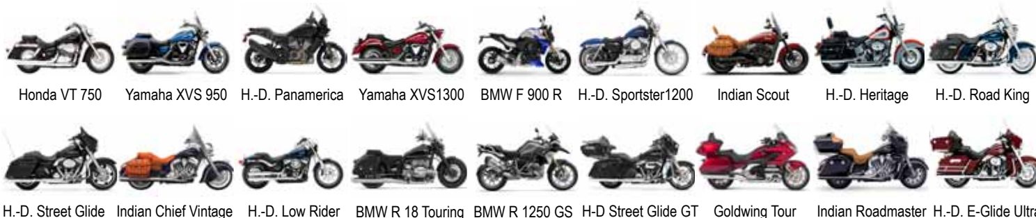
Honda VT 750