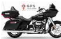
H-D. Road Glide Ultra