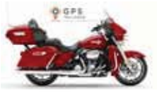
H-D. Electra Glide