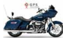
H-D. Road Glide