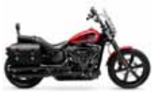
H-D. Street Bob