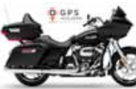
H-D. Road Glide G. T.