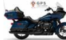
H-D. Road Glide Ultra