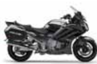
Yamaha FJR 1300