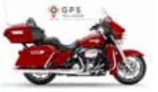
H-D. Electra Glide