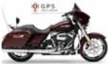
H-D. Street Glide