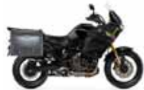
Yamaha Super Ténéré