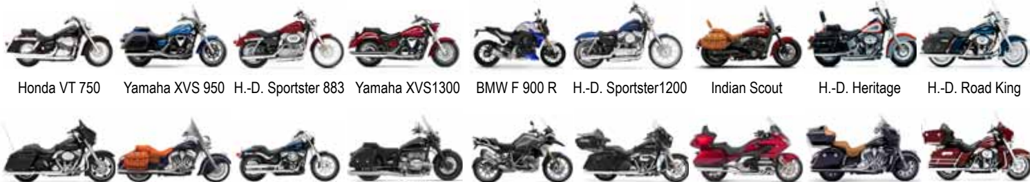
Honda VT 750 Yamaha XVS 950 H.-D. Sportster 883 Yamaha XVS1300 BMW F 900 R H.-D. Sportster1200 Indian Scout H.-D. Heritage H.-D. Road King