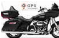
H-D. Road Glide G. T.