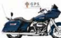
H-D. Road Glide