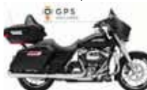
H-D. Street Glide G. T.