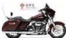
H-D. Street Glide