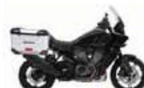
H-D. Pan America