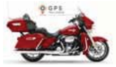
H-D. Electra Glide