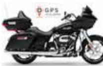
H-D. Road Glide Ultra