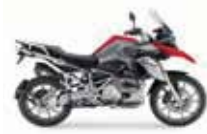
BMW R 1250 GS