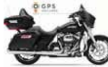
H-D. Street Glide G. T.