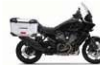
H-D. Pan American