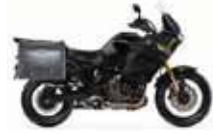
Yamaha Super Ténéré