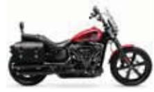
H-D. Street Bob