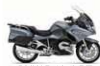
BMW R 1250 RT