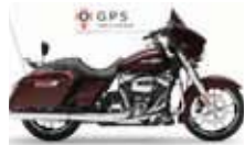
H-D. Street Glide