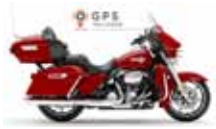
H-D. Electra Glide