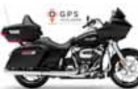
H-D. Road Glide G. T.