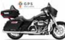
H-D. Street Glide G. T.