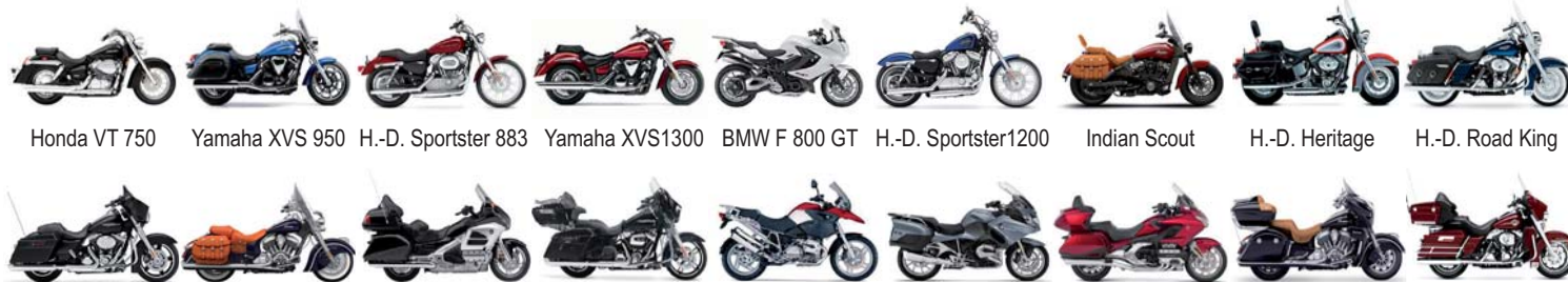
Honda VT 750 Yamaha XVS 950 H.-D. Sportster 883 Yamaha XVS1300 BMW F 800 GT H.-D. Sportster1200 Indian Scout H.-D. Heritage H.-D. Road King