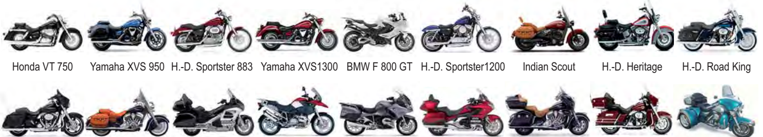
Honda VT 750 Yamaha XVS 950 H.-D. Sportster 883 Yamaha XVS1300 BMW F 800 GT H.-D. Sportster1200 Indian Scout H.-D. Heritage H.-D. Road King