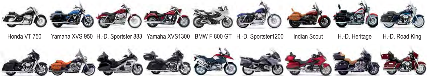
Honda VT 750 Yamaha XVS 950 H.-D. Sportster 883 Yamaha XVS1300 BMW F 800 GT H.-D. Sportster1200 Indian Scout H.-D. Heritage H.-D. Road King