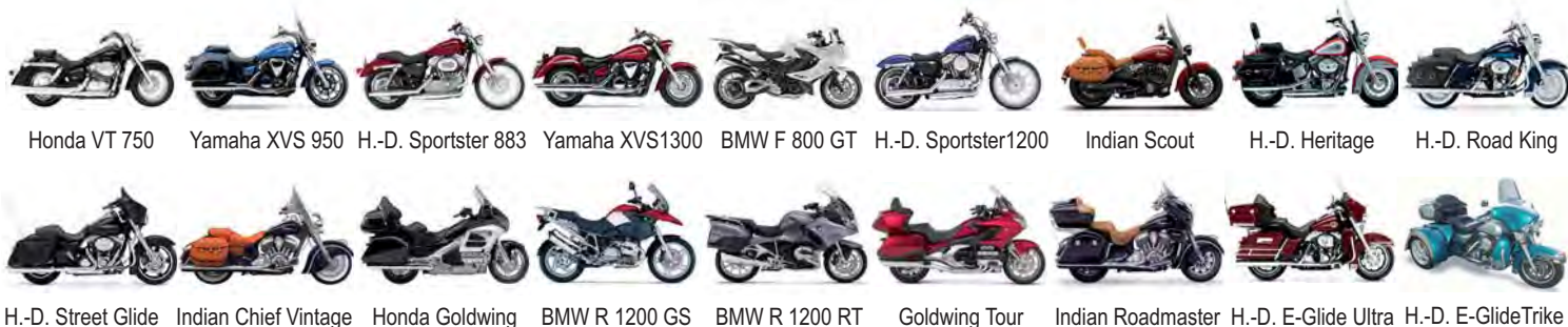
Honda VT 750 Yamaha XVS 950 H.-D. Sportster 883 Yamaha XVS1300 BMW F 800 GT H.-D. Sportster1200 Indian Scout H.-D. Heritage H.-D. Road King