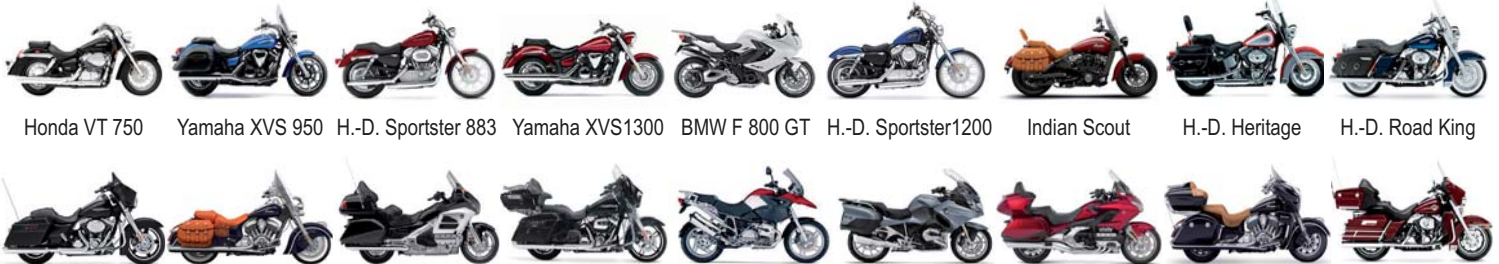
Honda VT 750 Yamaha XVS 950 H.-D. Sportster 883 Yamaha XVS1300 BMW F 800 GT H.-D. Sportster1200 Indian Scout H.-D. Heritage H.-D. Road King