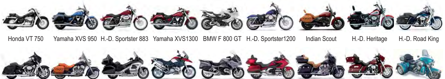
Honda VT 750 Yamaha XVS 950 H.-D. Sportster 883 Yamaha XVS1300 BMW F 800 GT H.-D. Sportster 1200 Indian Scout H.-D. Heritage H.-D. Road King