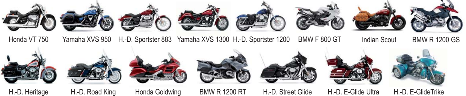
Honda VT 750