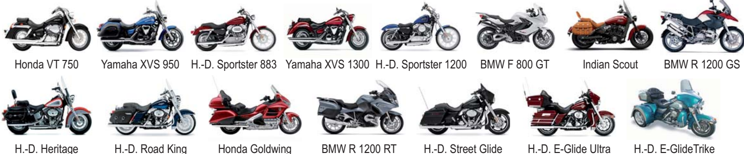
Honda VT 750