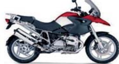
BMW R 1200 GS