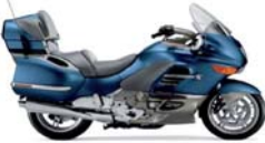
BMW K 1200 LT