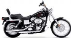
H-D. Dyna Wide Glide