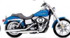
H-D. Low Rider