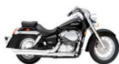
Honda VT 750