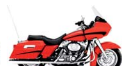
H-D. Road Glide