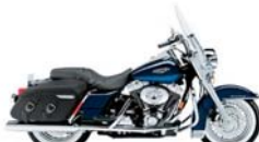
H-D. Road King