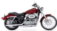
H-D. Sportster 883