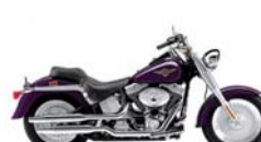
H-D. Fat Boy