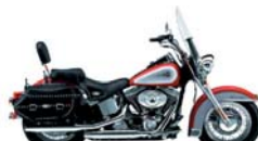
H-D. Heritage Softail