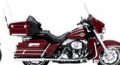
H-D. Electra Glide