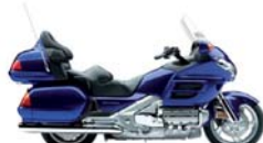
Honda Goldwing 1800