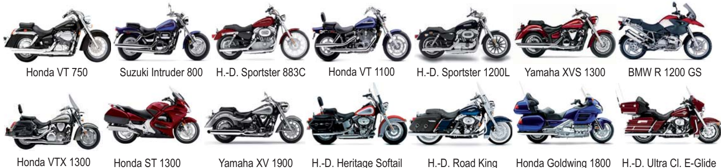
Honda VT 750