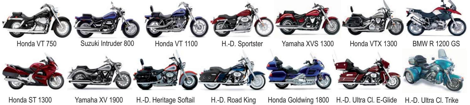
Honda VT 750