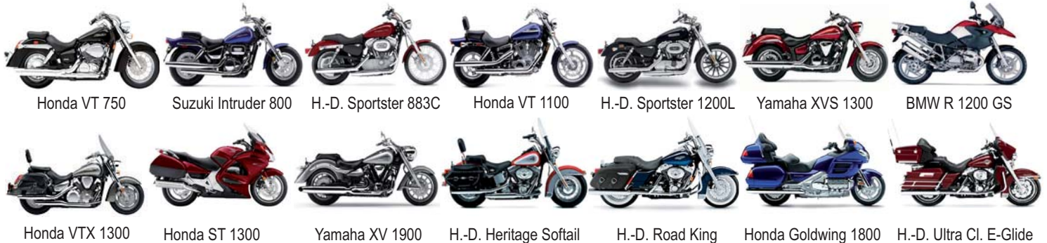
Honda VT 750